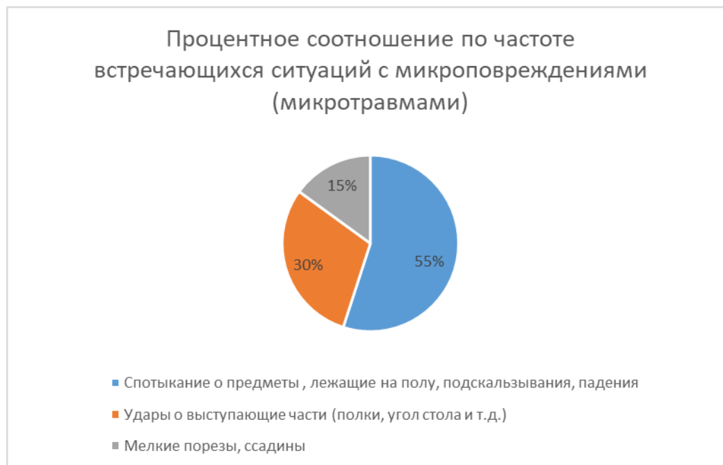
Рис. 2. Процентное соотношение по частоте встречающихся ситуаций с микроповреждениями (микротравмами) с учетом их классификации.

На круговой диаграмме ниже (Рис.2) приведено процентное соотношение по частоте встречающихся ситуаций с микротравмами, с учетом их классификации.