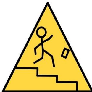
Рис. 3. «Внимание! При подъеме и спуске по лестнице используйте три точки опоры. Следует держаться за перила, а не телефон!»

На основе анализа причин получения микроповреждений (микротравм), автор статьи выявил основной предмет, из-за которого наиболее часто работники получают травмы. В тоже время предлагает свою разработку, а именно разработку полезной модели – сигнальный знак безопасности, которого нет в ГОСТ 12.4.026-2015 (Рис. 3, 4).