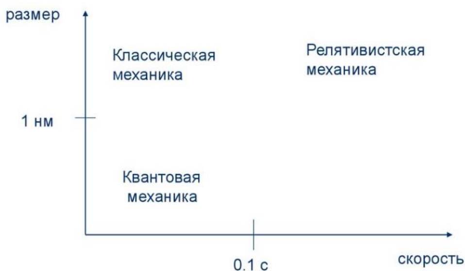
Рисунок 3. Пределы применимости классической механики.

Таким образом, развитие науки не перечеркнуло классическую механику, а лишь показало ее ограниченную применимость (рисунок 3). Динамика изучает движение тел в соответствие с причинами, его вызвавшими, т.е. рассматривает взаимодействие тел.