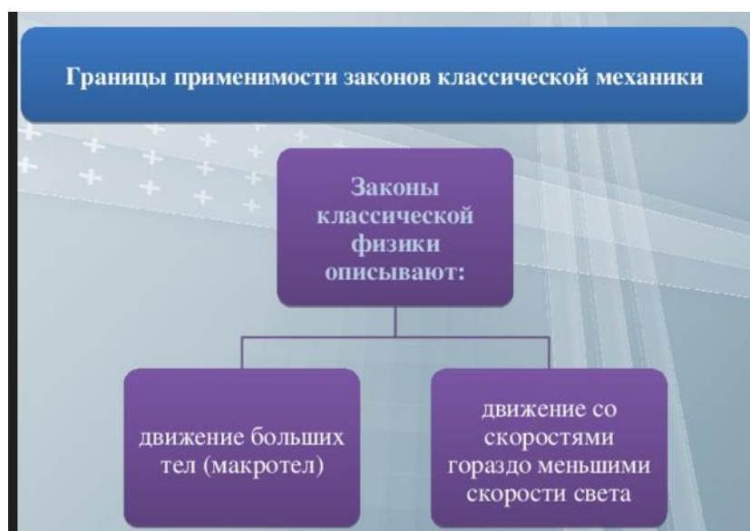
Рисунок 2. Законы классической механики.

Движение на скорости, близкой к скорости света, нельзя описать законами классической механики (рисунок 2).